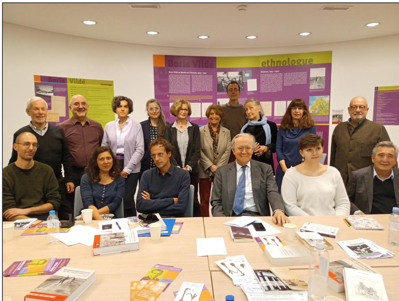
Salle Boris Vildé au Musée de l'Homme, le 23 février dernier : réunion consacrée à la commémoration de l'exécution des membres du réseau de Résistance du Musée de l'Homme.