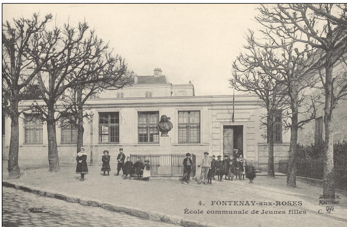
L'école des Filles vers 1910. AM Far série Fi